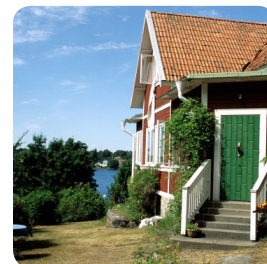
DOMICILE «SANS FIL»

POSTAL ADDRESS P.O. BOX 1236 SE-164 28 Kista SWEDEN